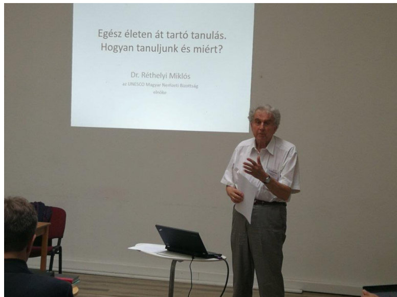
Dr. Réthelyi Miklós

A „környezet” az, amiben élünk; a „fejlesztés” pedig az, amit ebben az élettérben teszünk az életkörülményeink javítása érdekében. Ez a két fogalom elválaszthatatlan egymástól. A RUSDELA eszköztár a fenntarthatóság felé való átmenet módszereit tanítja, melyekben a környezet, a társadalom és a gazdaság egyformán jelen van, egyaránt fontos. Fogódzó a helyi kezdeményezők számára – az egész életen át tartó tanulás egyik tankönyve. [5]